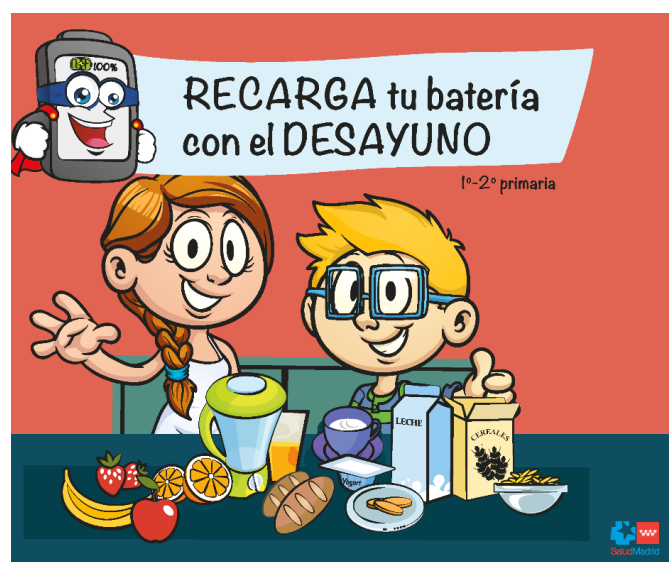
Imagen 1. Personajes del proyecto, los alimentos, el eslogan utilizado y el sello institucional

El proyecto lleva en marcha desde el año 2006, desde entonces, ha ido modificándose con la incorporación de mejoras a lo largo de los años. Uno de los últimos cambios más importantes, se realizó en 2017 al actualizar todo el material didáctico y hacer coincidir el comienzo del programa con el primer trimestre del curso escolar. El nuevo material didáctico consta de presentaciones en power point para proyectar en clase, carteles, salvamanteles, folletos y pegatinas para los alumnos, así como dípticos informativos para las familias.