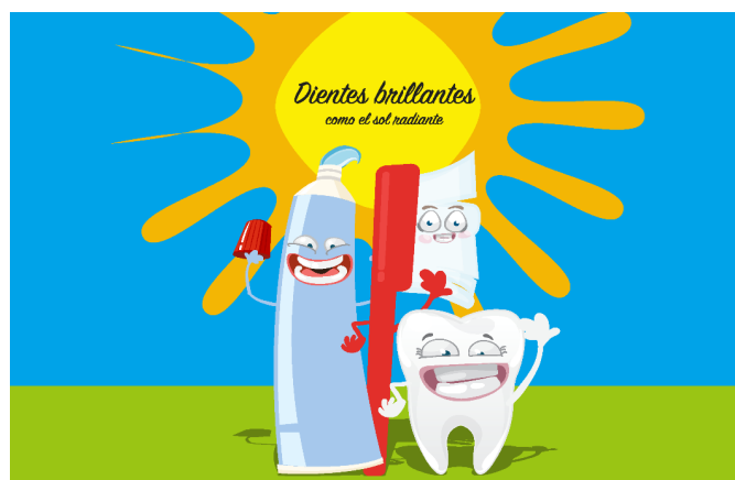
Imagen 2. Personajes de la presentación de los elementos que intervienen en higiene bucodental, el eslogan utilizado y el sello institucional

La población a la que fue destinado el proyecto fueron los escolares de primer (1 o , 2 o ) y tercer ciclo (5 o y 6 o ) de Educación Primaria, así como los familiares y el profesorado de los cursos de Educación Primaria e Infantil de los centros educativos públicos y concertados de la Comunidad de Madrid.